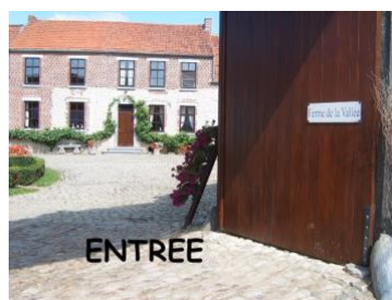
Entrée du matin ou du soir